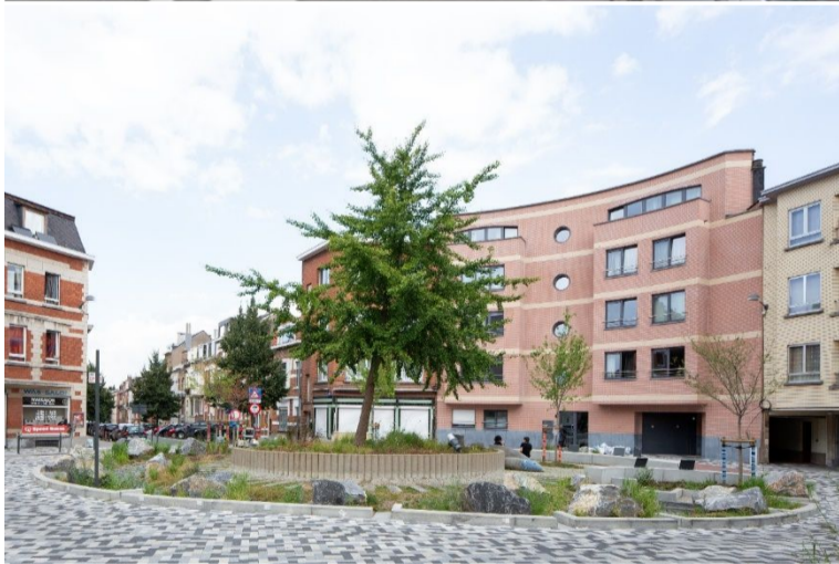
Pannenhuisplein in Jette vóór de herinrichting (boven, Streetview, 2017) en erna (onder, Séverin Malaud - urban)