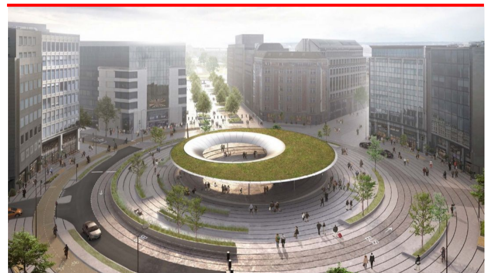
3D-weergave van de heraanleg van het Robert Schumanplein