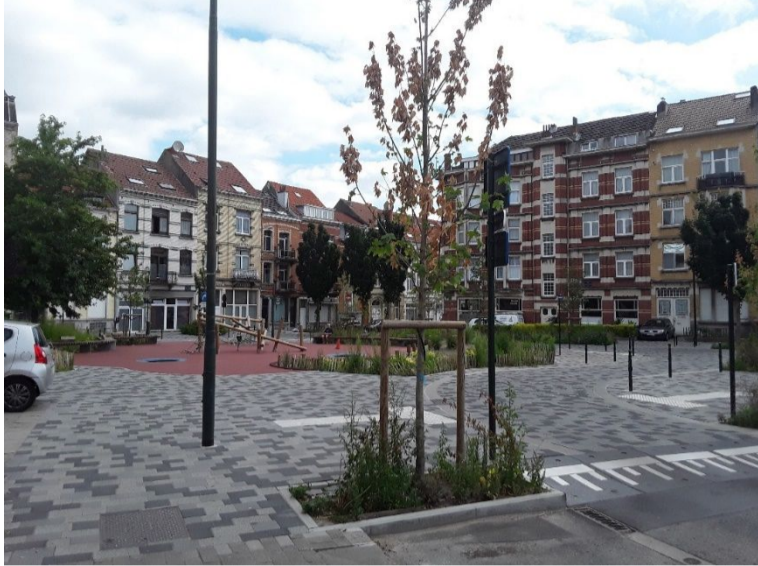
Reperplein in Laken vóór de herinrichting (boven, Mapillary, 2018) en erna (onder, BRAT, 2023)