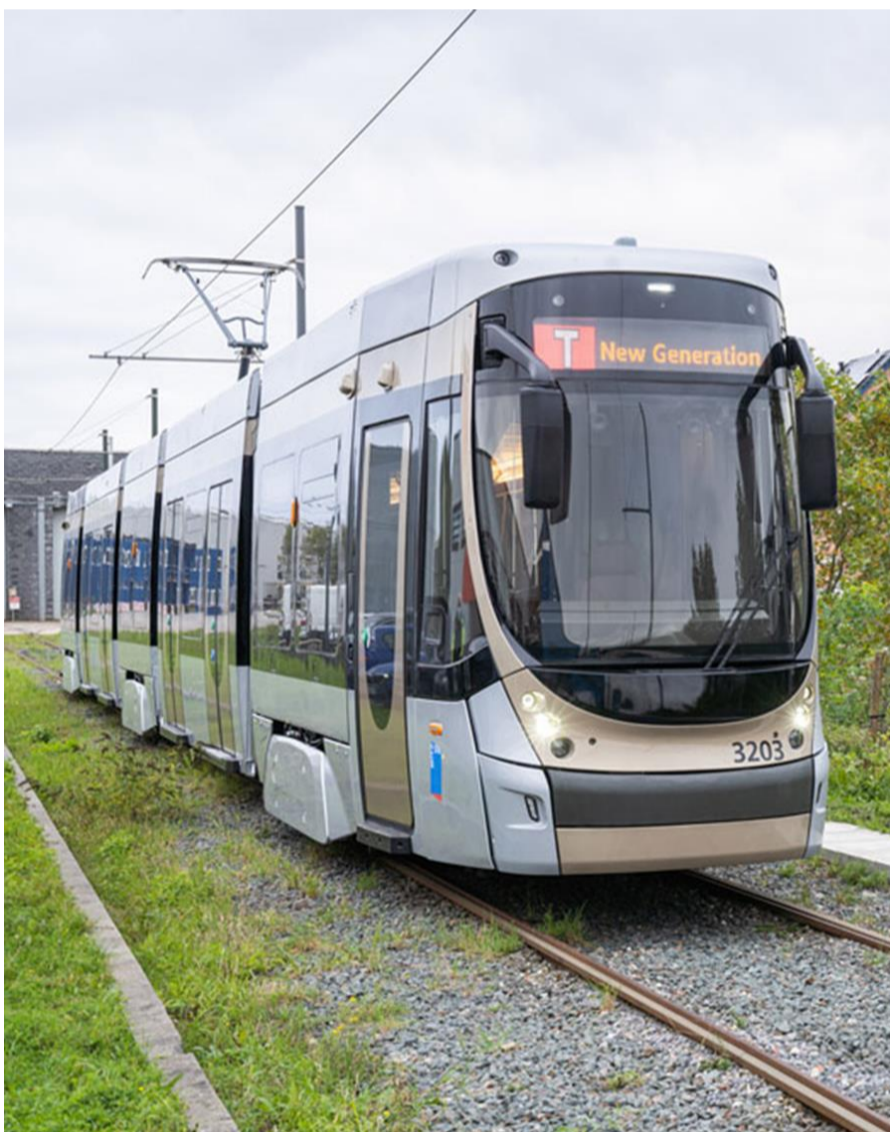
TNG, Tram New Generation

Aangezien de uitvoering van deze actie eerder regionaal van aard is, is er geen evaluatie van de uitvoering op gemeentelijk niveau.