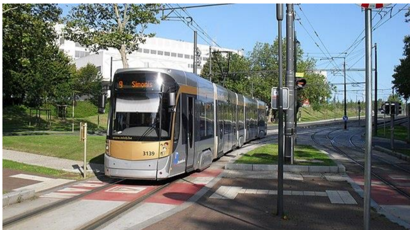
Tram 9 vóór de gebouwen van het UZ VUB