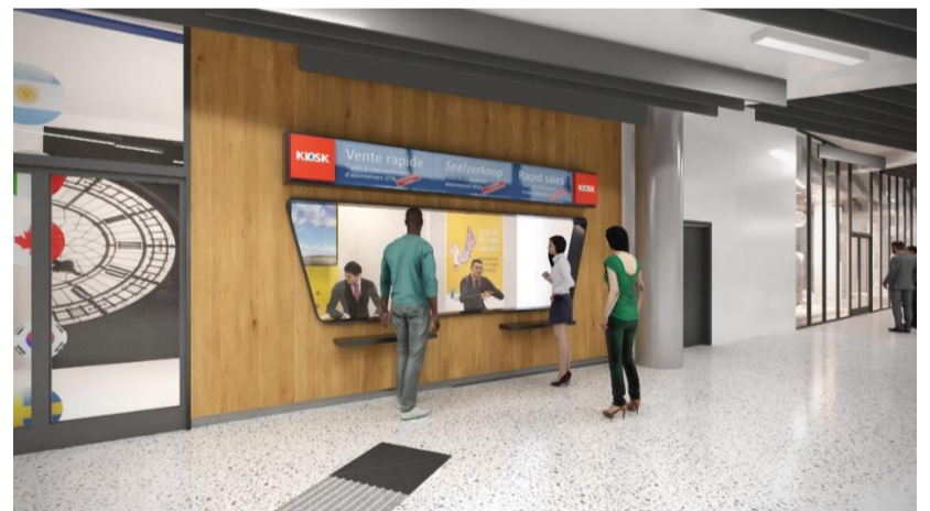
Overzichtsbild van de renovatie van het Centraal Station