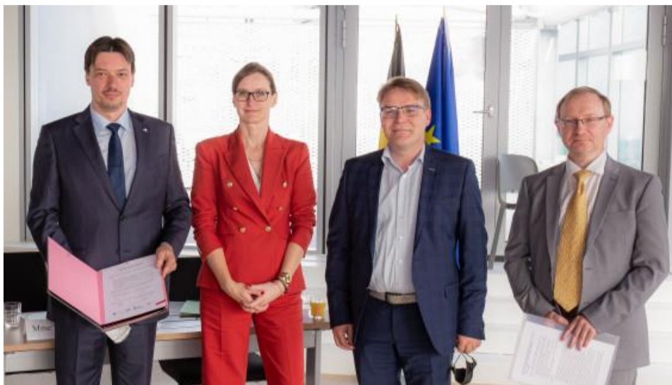
Ondertekening van de BE4MOVE-afsprakennota door de leidend ambtenaren van de 4 betrokken entiteiten