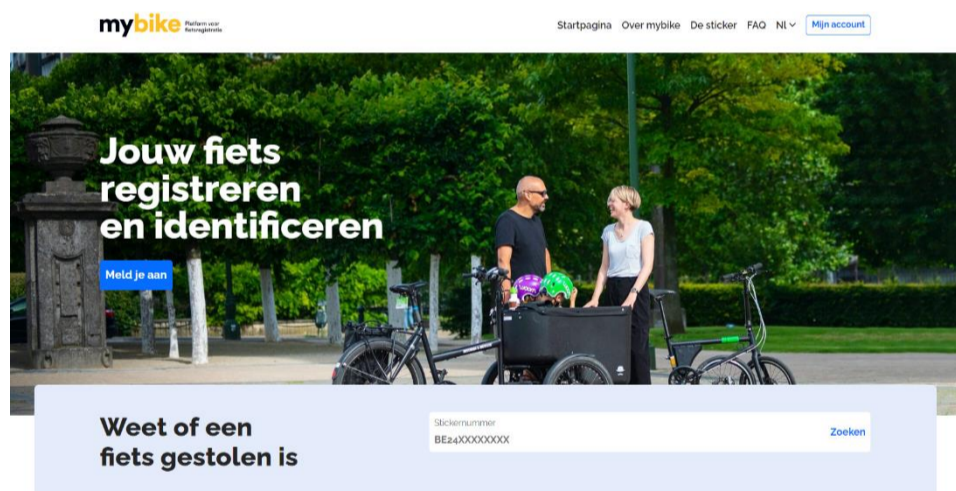
Website van mybike.belgium