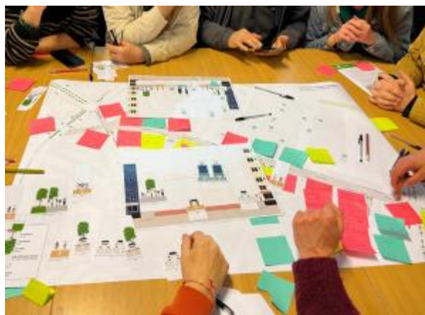
Participatieworkshop in het kader van de aanleg van een tramlijn