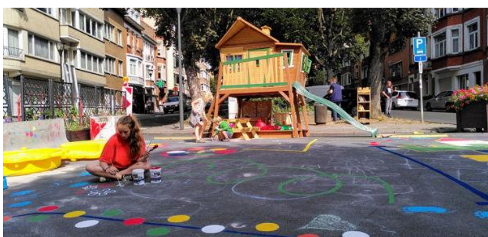
Een van de vele tijdelijke inrichtingen die werden gerealiseerd in het kader van de projectoproep “Brussel op vakantie”