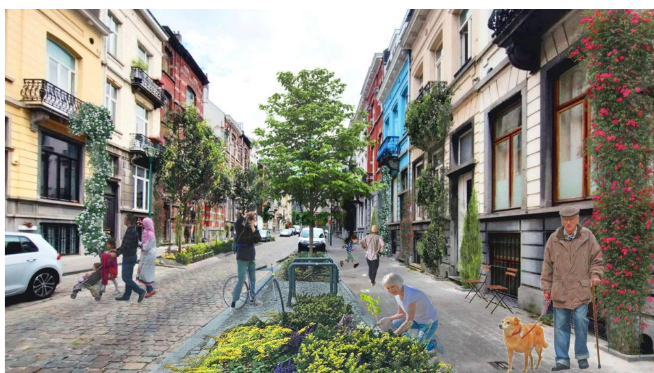
Afbeelding van een uitverkoren project van de projectoproep “Brussel plant!”