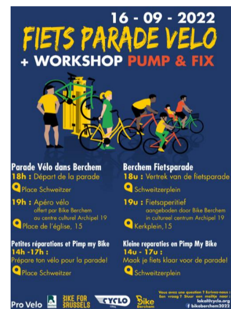
Bewustmakingscampagne voor het fietsen (Gemeente Sint-Agatha-Berchem)