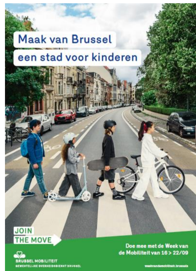
Communicatiecampagne over de Week van de Mobiliteit Thema: kindervriendelijke stad (op mensenmaat)