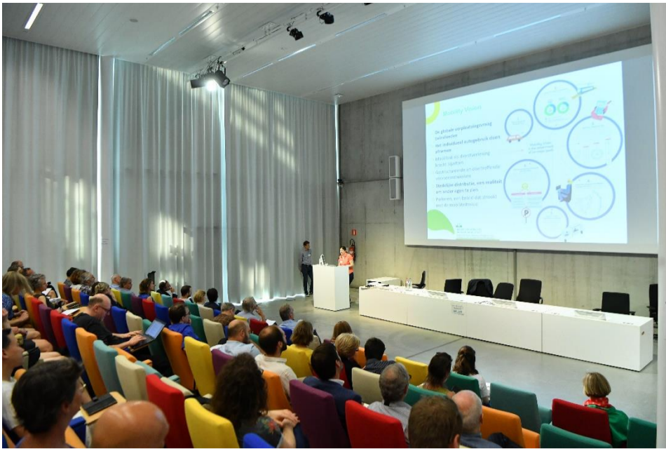
Colloque Good Move – Juin 2023