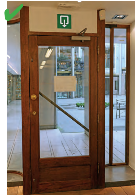
☺ Er is een nooduitgang van 0,90 cm breed, waardoor een persoon in een rolstoel kan vluchten.