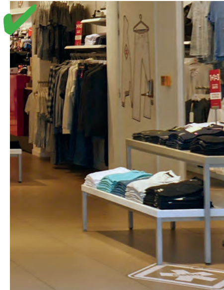
☺ Met deze displays kunnen producten worden genomen tussen 0,50 m en 1,30 m van de grond.