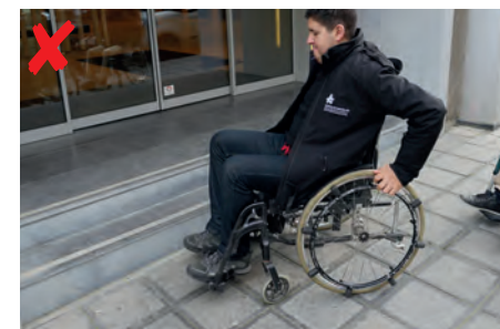
☹ De trappen voorkomen dat kwetsbare mensen en rolstoelgebruikers zelfstandig binnenkomen.