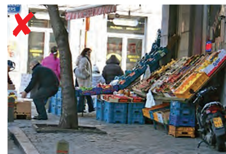
☹ De stal is te breed op het trottoir waardoor voetgangersverplaatsingen moeilijk zijn.