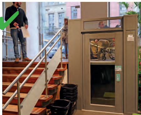
☺ Er is een vrachtlift voorzien voor mensen met een kinderwagen of rolstoel.