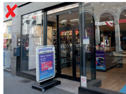
☹ Het bord belemmert de toegang en maakt verplaatsingen ingewikkeld.