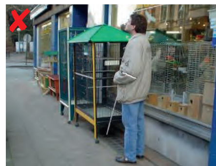
☹ Buitenmeubels belemmeren de verplaatsing van slechtzienden.