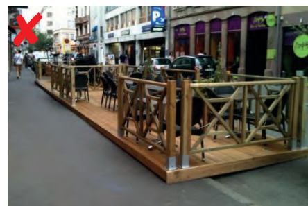
☹ Het terras is verhoogd, waardoor het moeilijk toegankelijk is.