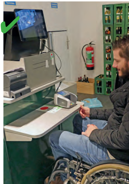
☺ De kassa heeft een gedeelte dat tot 80 cm van de grond is verlaagd, waardoor iedereen zonder problemen een transactie kan uitvoeren.