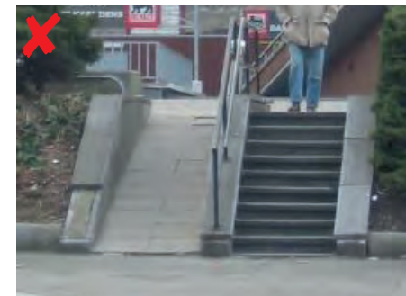
☹ De oprit is te steil, wat een gevaar vormt voor mensen in een rolstoel.