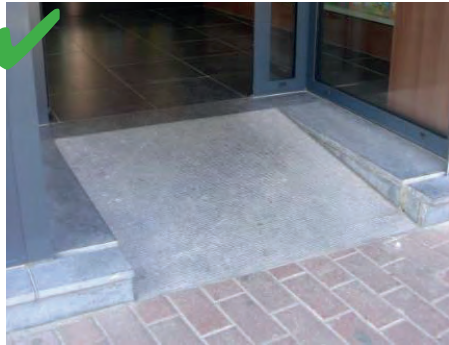
☺ De dorpel werd naar binnen ingehaald door een zachte helling.