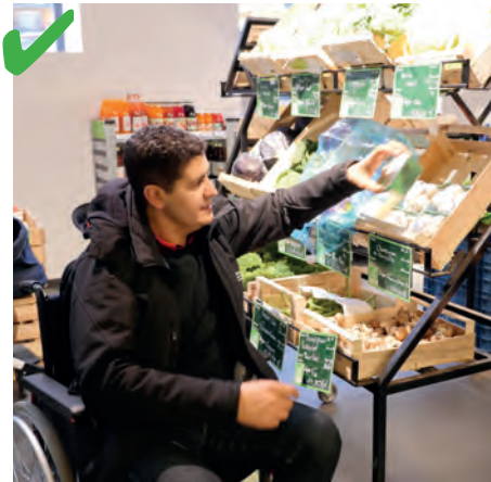
☺ Displays zijn vrij laag, de goederen zijn haalbaar voor kleine mensen en mensen in een rolstoel.